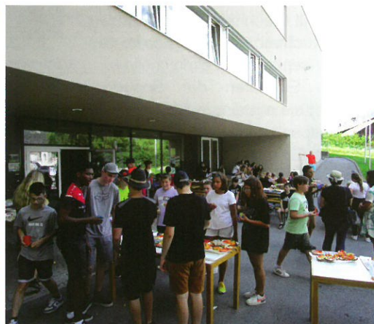
bis die Tagessieger feststanden und es für alle eine gute Jause gab.

diesem Tag unglaubliche 7.508,90 Euro für notleidende Familien aus der Ukraine gesammelt.